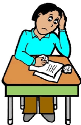
Los exámenes están diseñados para clasificar y separar a los estudiantes.

Existe un reconocido intervalo de logro entre los resultados de los exámenes de estudiantes blancos y asiáticos y los estudiantes afro-americanos y latinos. En vez de ayudar a todos los niños a realizarse, este énfasis exagerado en los exámenes estandarizados identificará a más niños minoría y sus calificaciones como fracasos.